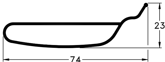
628 - Tablilla Tubular peso: 0,48 Kg/m