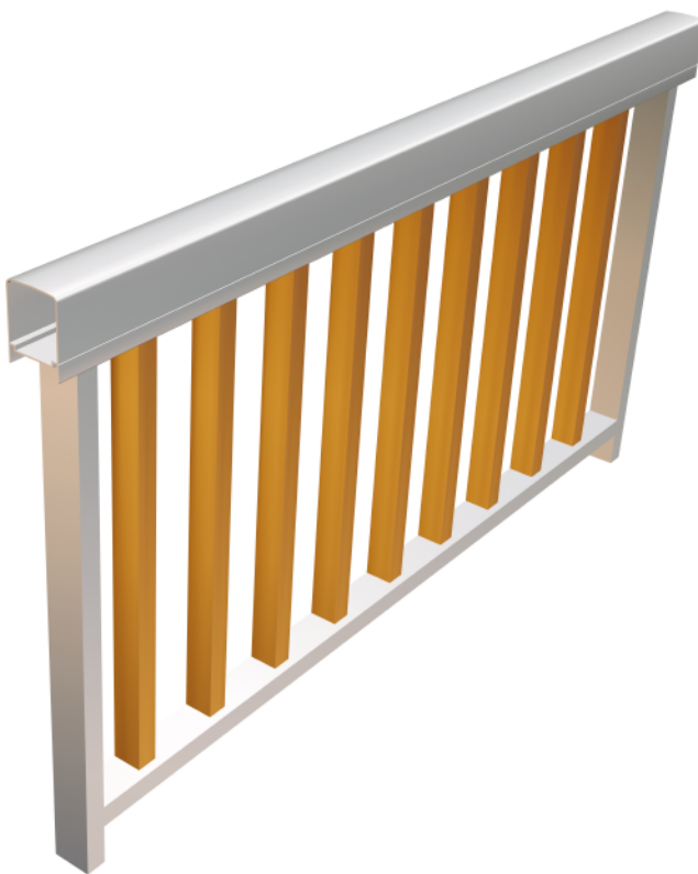
Modelo en 3D - Baranda Clásica con parante angosto 478